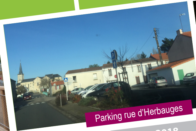
Parking rue d'Herbauges