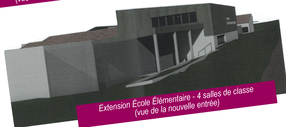
Extension École Élémentaire - 4 salles de classe (vue de la nouvelle entrée)

Programmation de l'extension du groupe scolaire Les Halbrans maternelle et élémentaire