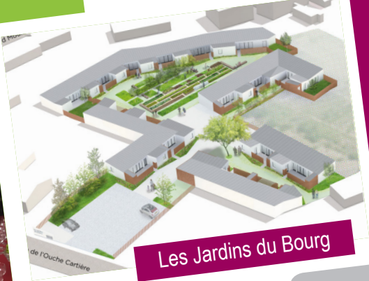
Les Jardins du Bourg