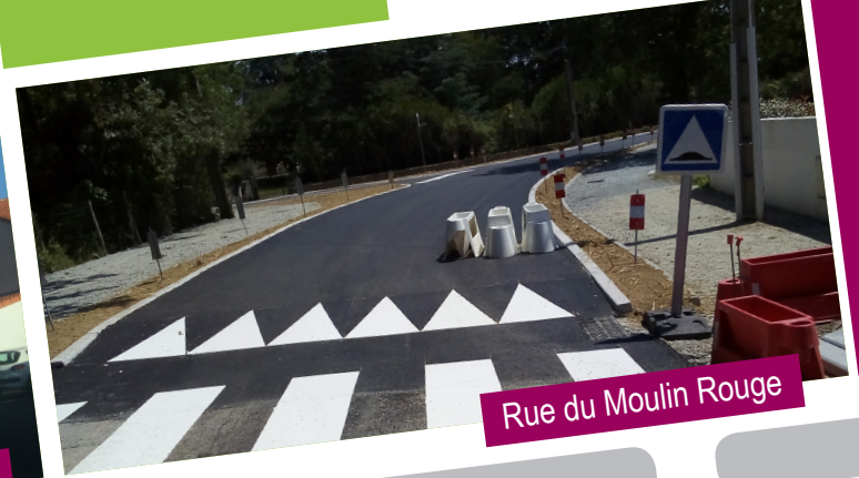
Rue du Moulin Rouge