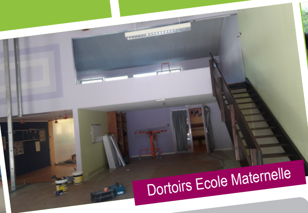
Dortoirs Ecole Maternelle