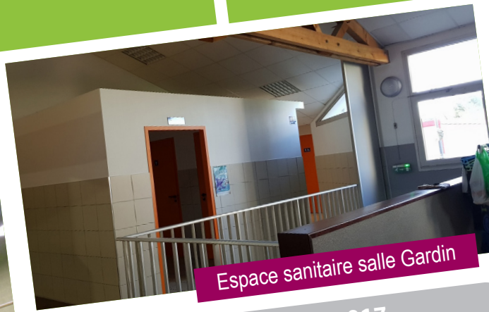
Espace sanitaire salle Gardin