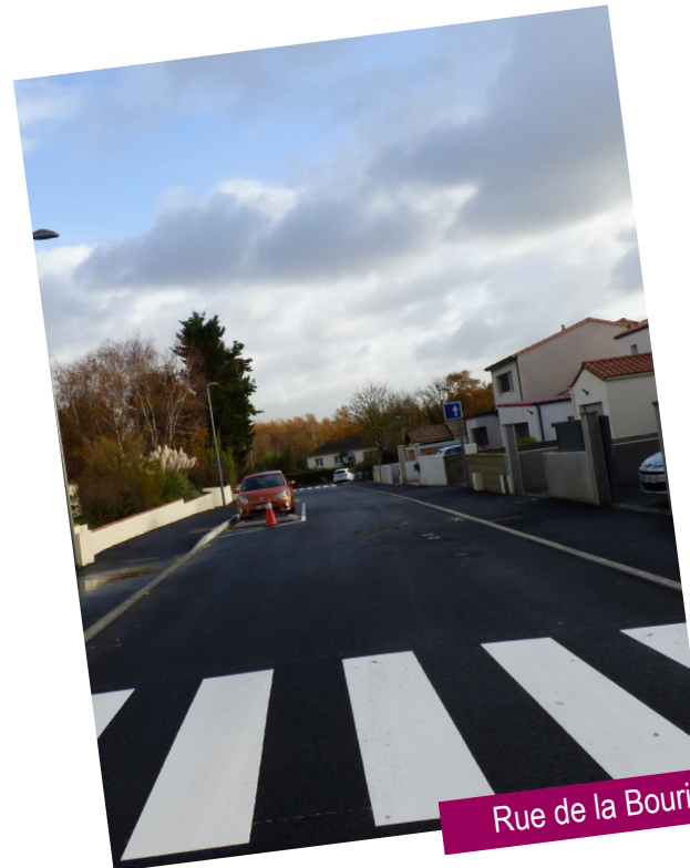
Rue de la Bourie