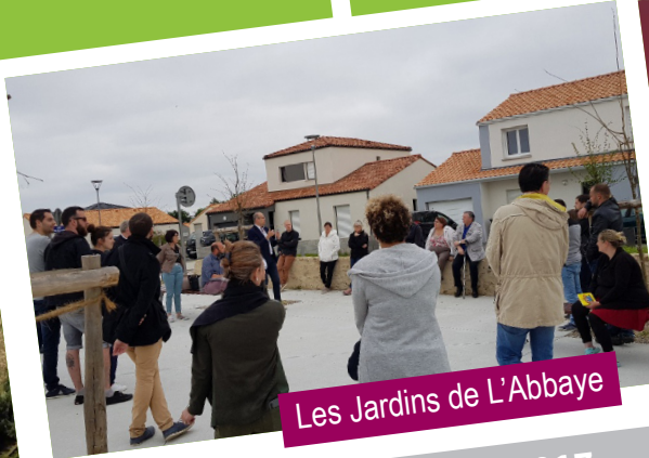
Les Jardins de L'Abbaye