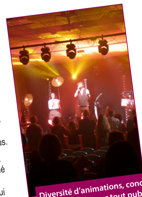
Diversité d'animations, concerts, spectacles pour tout public