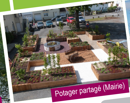
Potager partagé (Mairie)

Réalisation d'un bassin de rétention d'eaux pluviales au coeur du lotissement de la Noé Thébaud