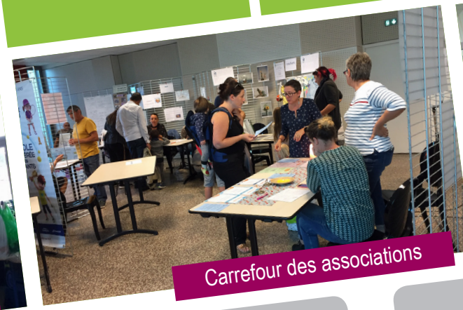
Carrefour des associations