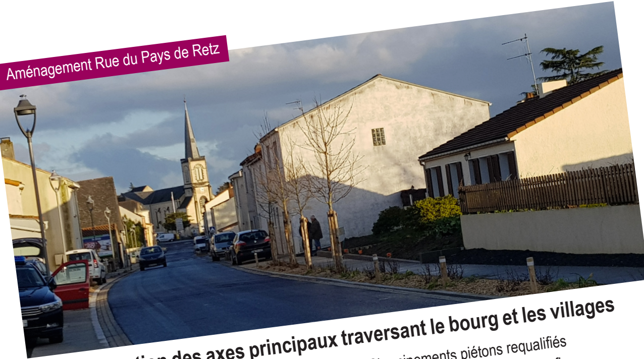
Aménagement Rue du Pays de Retz

La sécurité et la fluidité, notre priorité