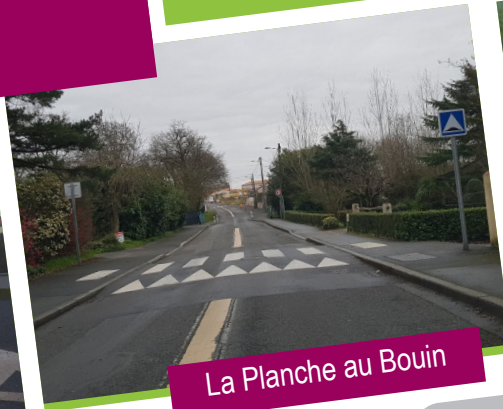
La Planche au Bouin

Outre les trois grands axes du bourg, nous avons privilégié également les réalisations d' aménagements sécuritaires dans les villages de La Bauche Tue Loup, les Ménanties, rue de Lavau, la Coletterie, rue de la Gautellerie et du Champsiôme, rue de la Tête des Landes, rue de la Haugardière, La Bourie, rue des Sables, rue du Moulin Rouge, rue de la Vincée et à La Planche au Bouin, soit plus de 3,75 km de voiries restaurées et aménagées