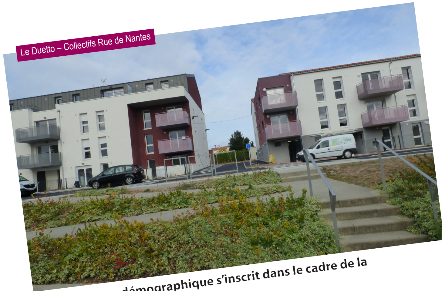
Le Duetto – Collectifs Rue de Nantes

La dynamique démographique s'inscrit dans le cadre de la densification.