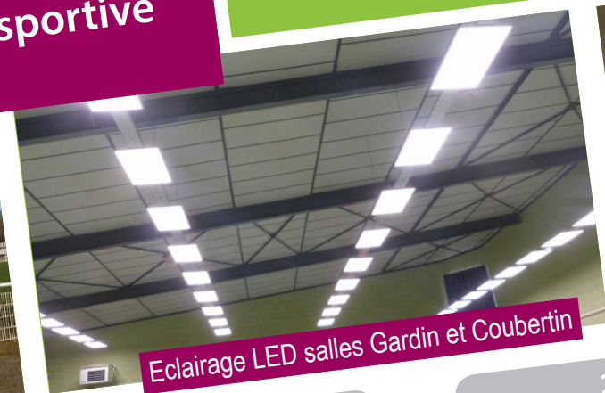
Eclairage LED salles Gardin et Coubertin