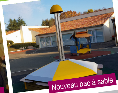
Nouveau bac à sable