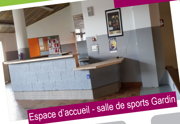
Espace d'accueil - salle de sports Gardin