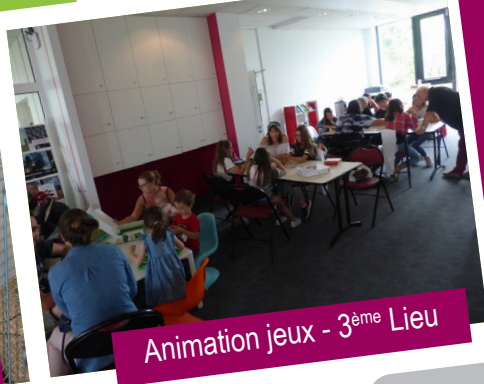
Animation jeux - 3 ème Lieu