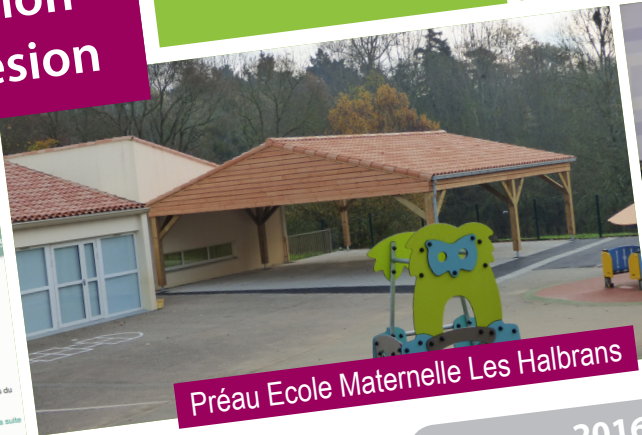
Préau Ecole Maternelle Les Halbrans

1 produit BIO par semaine Produits locaux labellisés et de saisons sont privilegiés