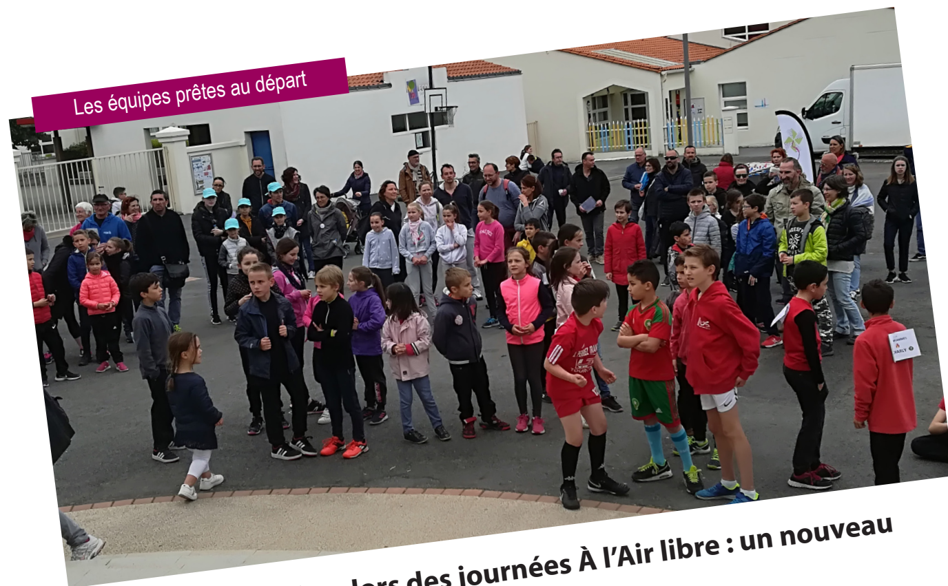
Les équipes prêtes au départ

«Challenge Familles» lors des journées À l'Air libre : un nouveau concept fédérateur