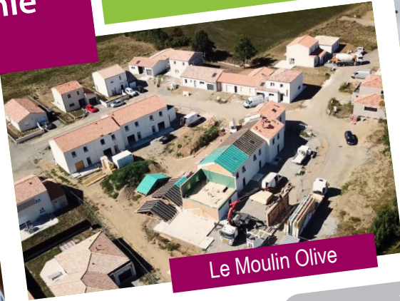
Le Moulin Olive