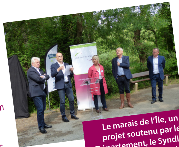
Le marais de l'Île, un projet soutenu par le Département, le Syndicat du Bassin Versant de Grand-Lieu, la Région et l'Europe