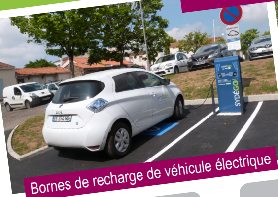
Bornes de recharge de véhicule électrique