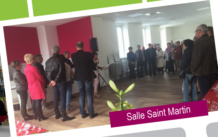
Salle Saint Martin