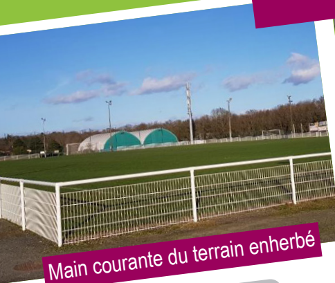
Main courante du terrain enherbé