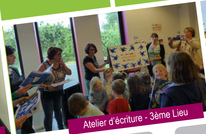
Atelier d'écriture - 3ème Lieu

Aide aux devoirs dans le cadre des activités scolaires