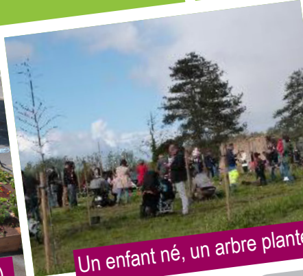
Un enfant né, un arbre planté