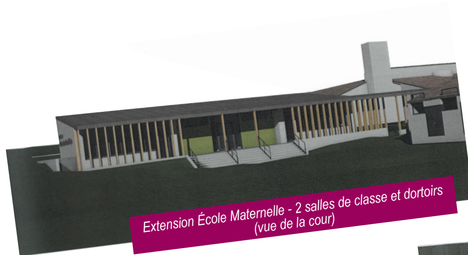
Extension École Maternelle - 2 salles de classe et dortoirs (vue de la cour)

Donner à tous les enfants les mêmes chances et à toutes les familles les mêmes services